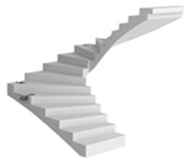
Auszug aus dem Maba-Treppen-Programm (gerade Treppe mit/ohne Podest, Winkeltreppe, Wendeltreppe)

Die Treppe ist im Standard für einen 2,0 cm Belag ausgelegt, eine Erhöhung bis zu 4,0 cm ist bei der Bemusterung möglich.