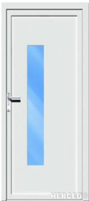
Modell A d